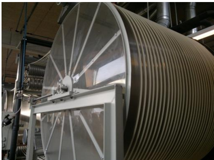
Kerzenzug für Baum- und Opferkerzen

Im Laden konnte man sich für Weihnachten mit Kerzenmaterial eindecken.