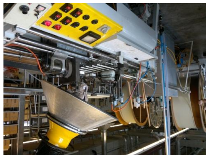
Hier werden die Kerzen zugeschnitten,