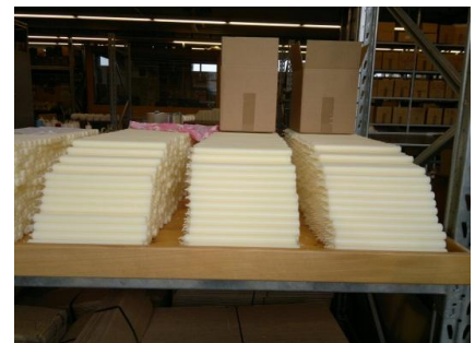
gestapelt und verpackt