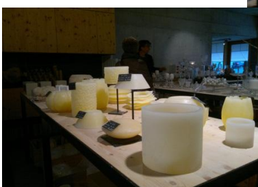
Eine Auswahl von Kerzen