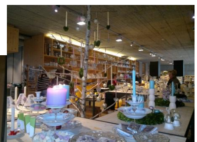
Ausstellung im Laden