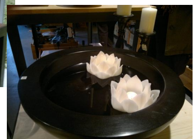
Den Formen werden keine Grenzen gesetzt