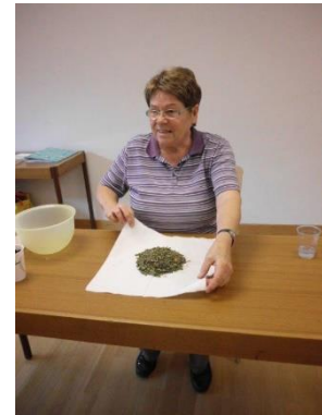
Anleitung zur Herstellung von Stempeln