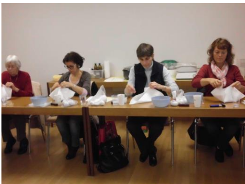
Jeder Teilnehmer durfte 2 Stempel herstellen