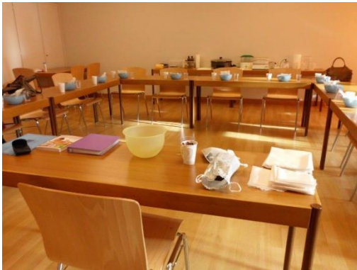
Vorbereitung des Kurses

Inhalt: Herstellung von Kräuterstempel und praktische Anwendung für Schönheit und Wohlbefinden. Im Kurs wurden speziell Gesicht, Hals, Dekolleté, Nacken und ein Teil des Rückens massiert. Anwesend waren 11 Teilnehmerinnen.