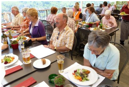
Hier genossen wir einen feinen Firnessteller.

Gestärkt marschierten wir via Buriel durch wunderschöne Wälder zum Rhyspitz, wo eine Glace- und Bierrunde anstand.